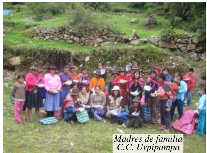
Madres de familia C.C. Uripipampa