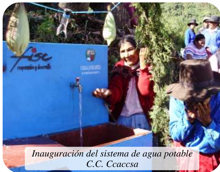
Inauguración del sistema de agua potable C.C. Ccaccsa

EQUIDAD EN 21 COMUNIDADES INDIGENAS DE ABANCAY Y PICHIRHUA”, ejecutado por Cáritas Abancay y por la cooperante F.I.S.C. Tercer Mundo, COOPERACION Y DESARROLLO, financiado por el Gobierno Vasco de España.