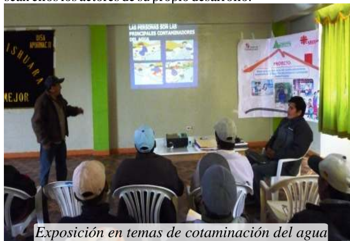
Exposición en temas de cotaminación del agua

De esta forma Caritas Abancay, viene contribuyendo a organizar y fortalecer las capacidades de la población para que sean ellos los actores de su propio desarrollo.