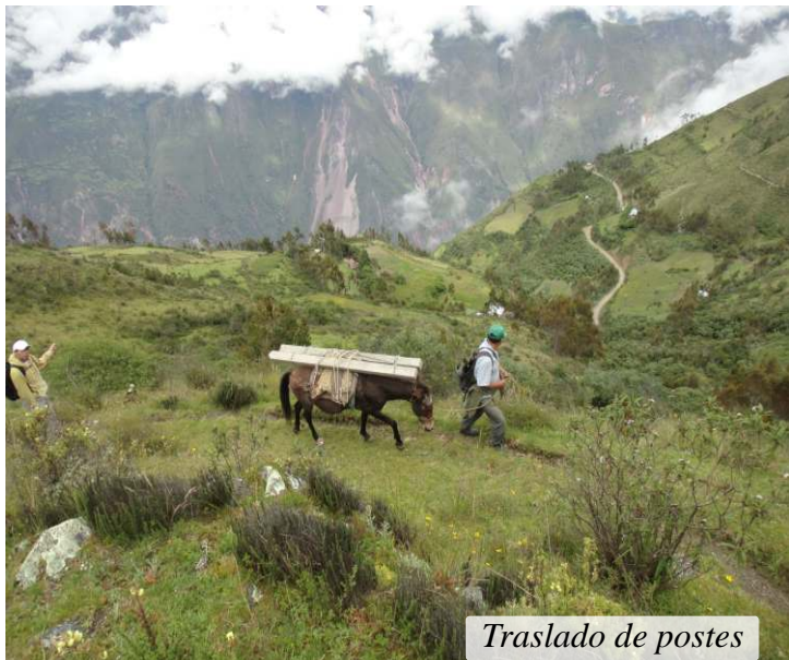
Traslado de postes

Los pobladores de Facchacpata están agradecidos por esta labor que se les encomendó, previa sensibilización, y seguirán trabajando hasta culminar la instalación e implementación de la REPANA, asegurando que los/as futuros/as pobladores/as tengan un camino lleno de esperanzas.