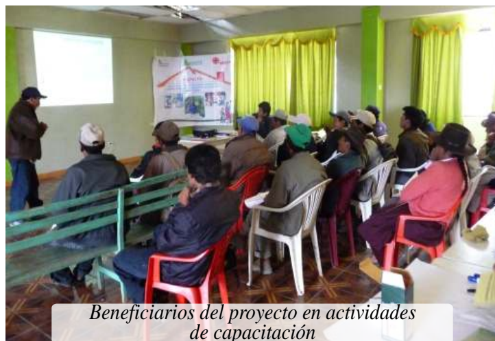
Beneficiarios del proyecto en actividades de capacitación