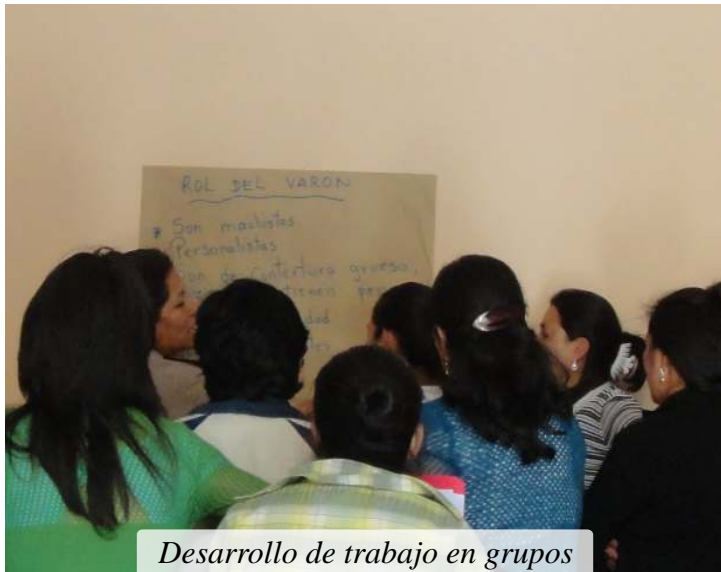
Desarrollo de trabajo en grupos