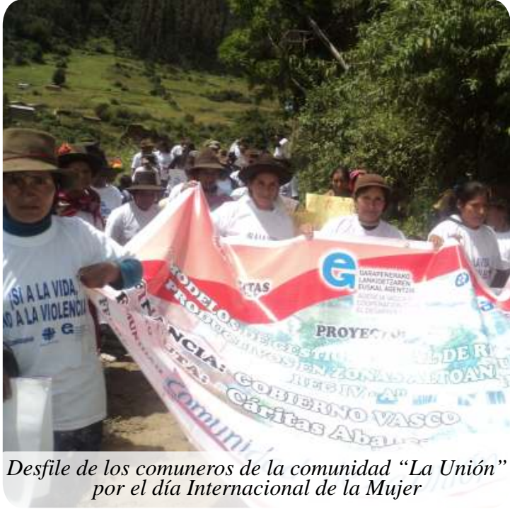
Desfile de los comuneros de la comunidad “La Unión” por el día Internacional de la Mujer

Por motivos del día internacional de la mujer, el día 08 de marzo se ha realizado la campaña de sensibilización contra la violencia familiar, habiendo participado la población y sus autoridades, quienes realizaron un pasacalle por las diferentes arterias de la comunidad mostrando carteles alusivos a la fecha.