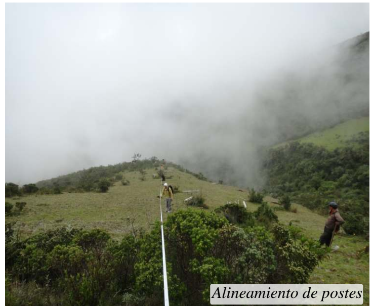
Alineamiento de postes