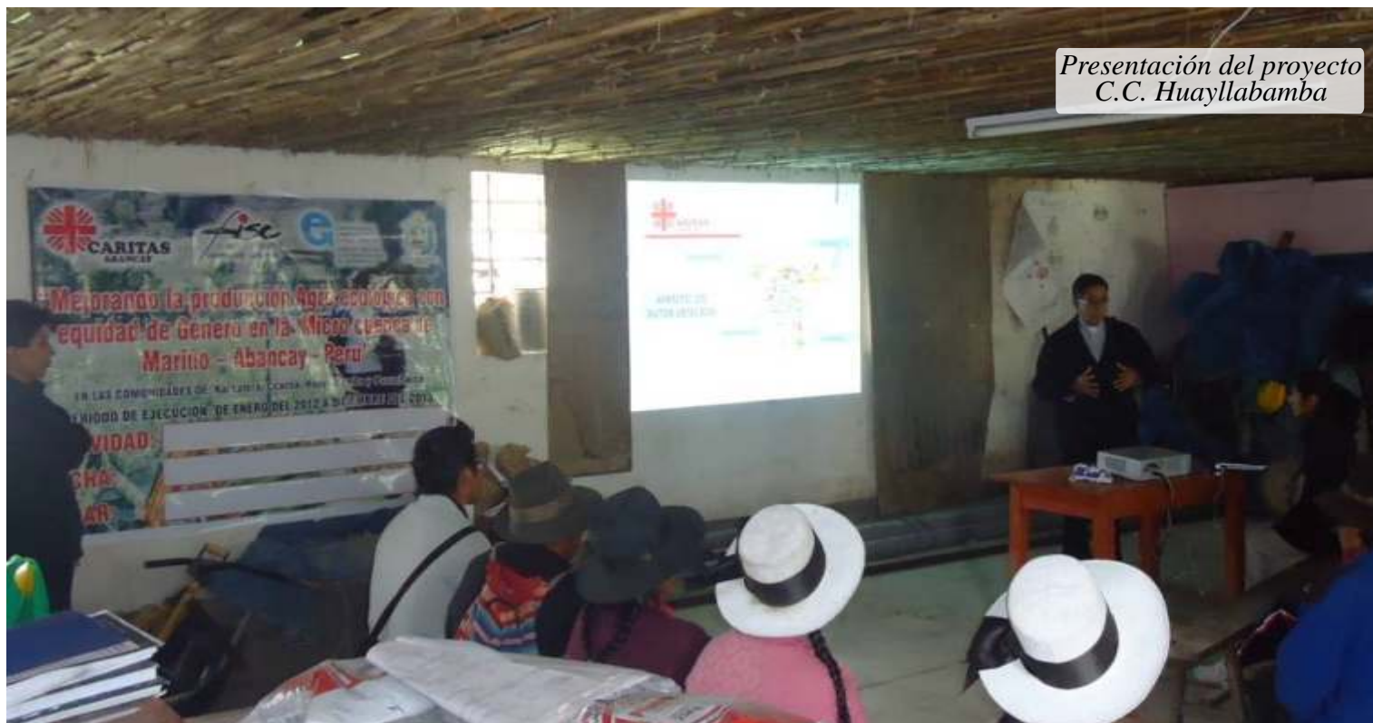
Presentación del proyecto C.C. Huayllabamba

Cáritas Abancay es una institución de la Iglesia Católica que dentro de la jurisdicción de la diócesis de Abancay viene desarrollando diversos proyectos de desarrollo rural, dentro de ellos tiene; proyectos de carácter productivo, social, de infraestructura, educativo, de salud, agroecológicos y de protección del medio ambiente esto lo viene realizando ya más 20 años; en forma concertada con instituciones públicas y privadas dentro de la región Apurímac y con aliados estratégicos como cooperantes del exterior, a favor de las comunidades con mayor necesidad y de extrema pobreza.