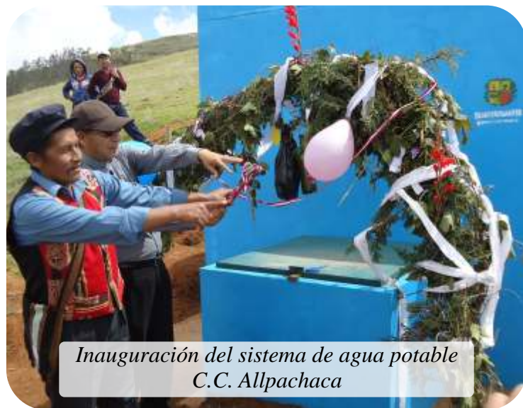
Inauguración del sistema de agua potable C.C. Allpachaca

El proyecto que hemos comentado es mucho más grande del de Pichirhua. Se llama: “AGUA POTABLE Y PARTICIPACION CIUDADANA EN