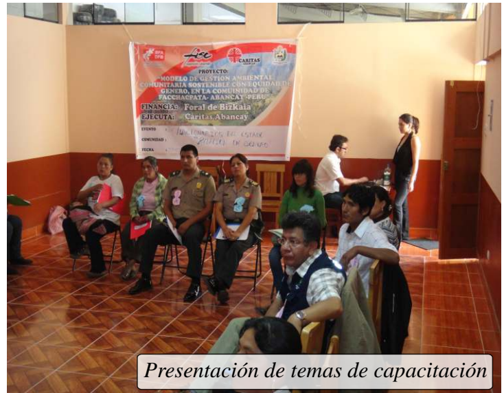
Presentación de temas de capacitación

Con el proyecto: Modelos de gestión ambiental comunitaria sostenible con equidad de género, en la comunidad de Facchacpata – Abancay – Apurímac , FINANCIADO por las COOPERANTES DIPUTACION FORAL DE BIZKAIA Y FISC cooperación y Desarrollo