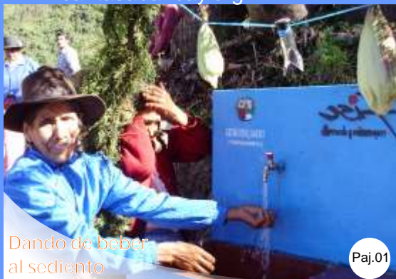
Dando de beber al sediento