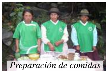
Preparación de comidas