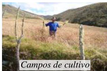
Campos de cultivo