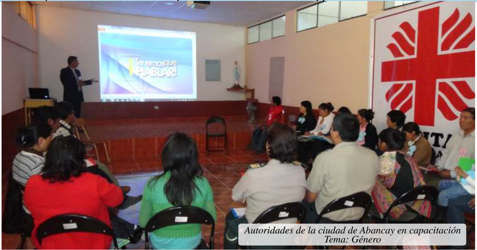
Autoridades de la ciudad de Abancay en capacitación Tema: Género