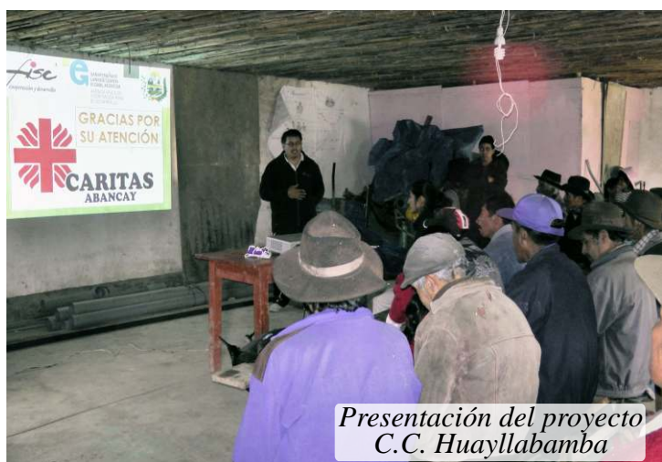
Presentación del proyecto C.C. Huayllabamba

con equidad de género en la micro cuenca de Mariño – Abancay - Perú”, gracias al apoyo Financiero del Gobierno Vasco y la Cooperación Fisc Tercer Mundo, mediante el que se beneficiara a 04 comunidades del distrito de Abancay como son Karkatera, Ccaca, Puruchaca y Huayllabamba, donde se beneficiaran más de 270 familias directas y un promedio 1000 familias indirectas, teniendo como ejes principales la protección del medio ambiente mediante la agricultura