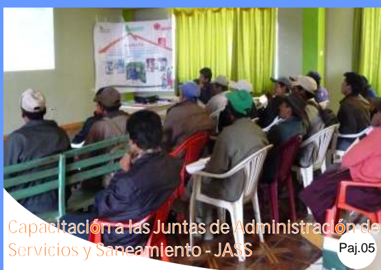
Capacitación a las Juntas de Administración de Servicios y Saneamiento - JASS