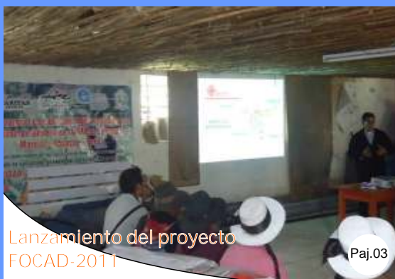
Lanzamiento del proyecto FOCAD-2011

Según el Papa, "en este Año, las comunidades religiosas, así como las parroquiales, y todas las realidades eclesiales antiguas y nuevas, encontrarán la manera de profesar públicamente el Credo ".