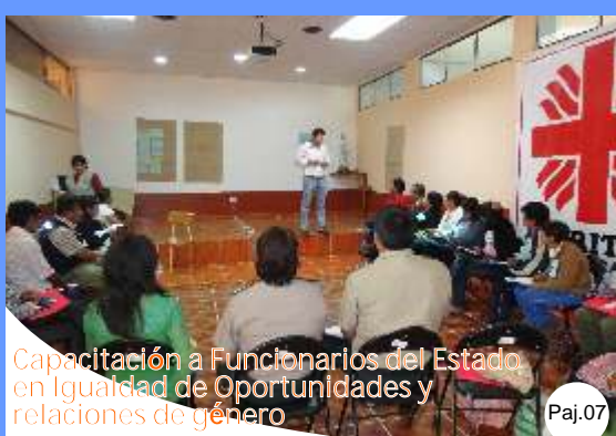
Capacitación a Funcionarios del Estado en Igualdad de Oportunidades y relaciones de género