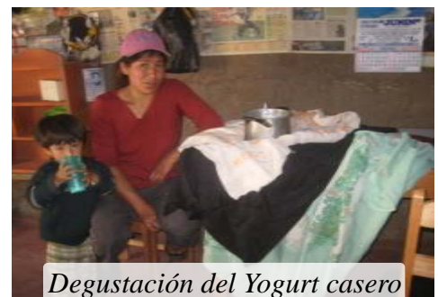
Degustación del Yogurt casero