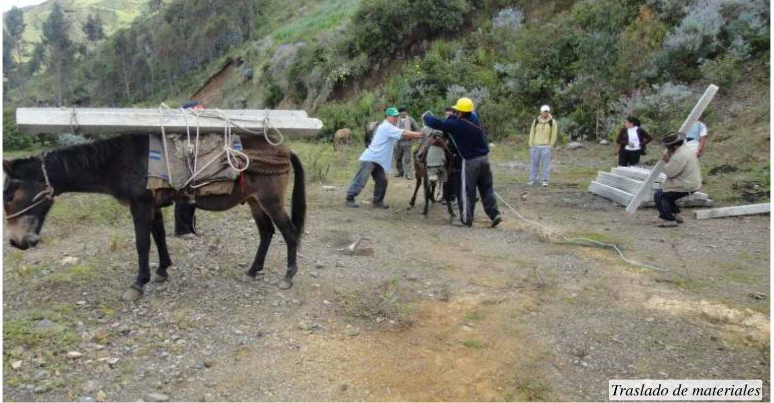
Traslado de materiales

Cáritas Abancay, gracias a la cooperación de la Diputación Foral de Bizkaia y la ONG FISC Cooperación y Desarrollo, con el proyecto “Modelos de gestión ambiental sostenible comunitaria con enfoque de genero, en la comunidad de Facchacpta – Abancay - Perú”, conjuntamente con los/as beneficiarios/as de la comunidad de Facchacpata, se realiza el traslado de materiales para la instalación e implementación de la REPANA. Esta actividad busca mejorar la gestión ambiental sostenible protegiendo el recurso hídrico, flora y fauna.