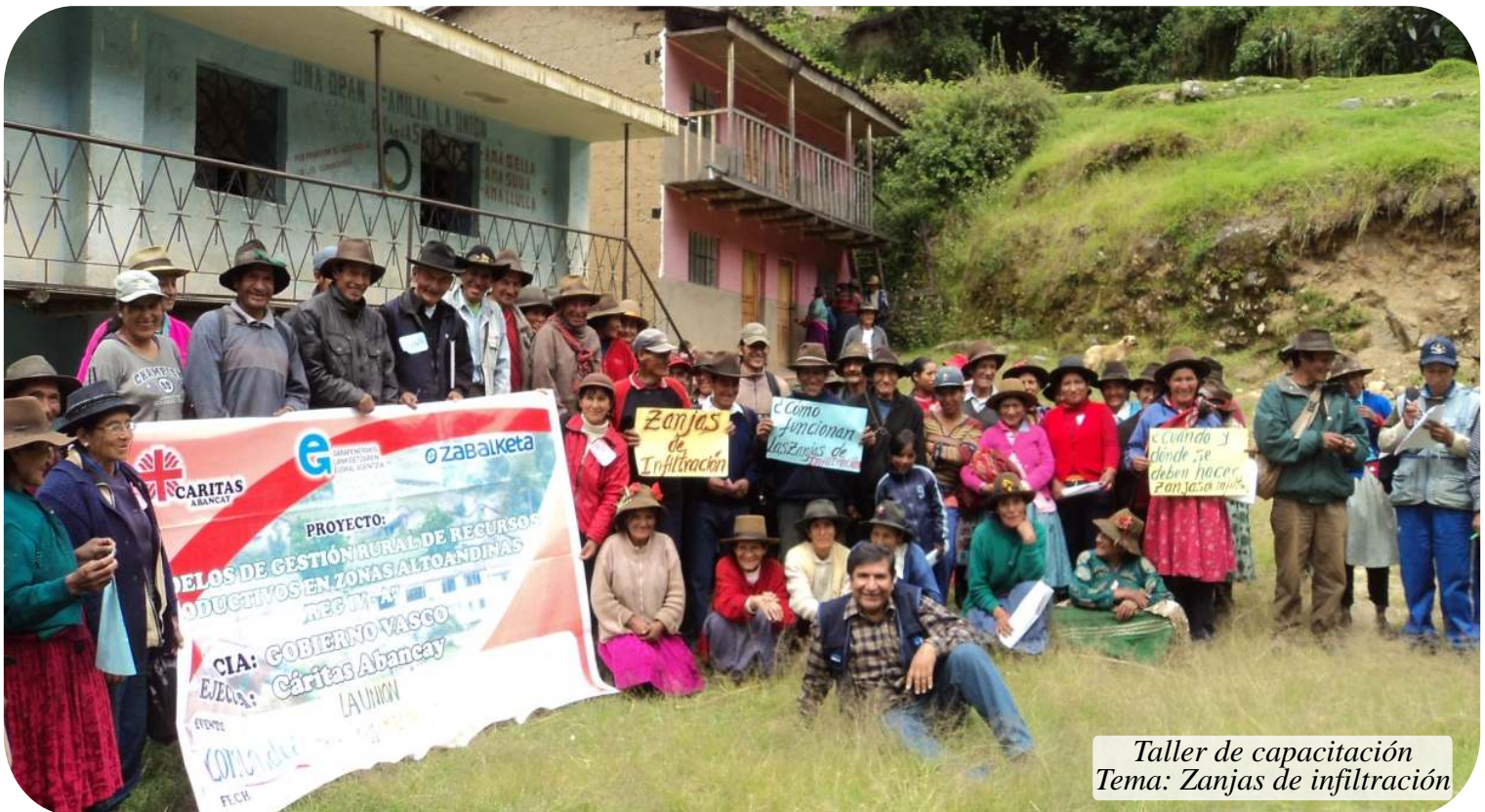
Taller de capacitación Tema: Zanjas de infiltración