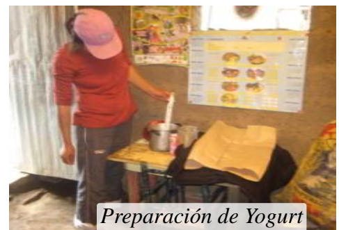
Preparación de Yogurt